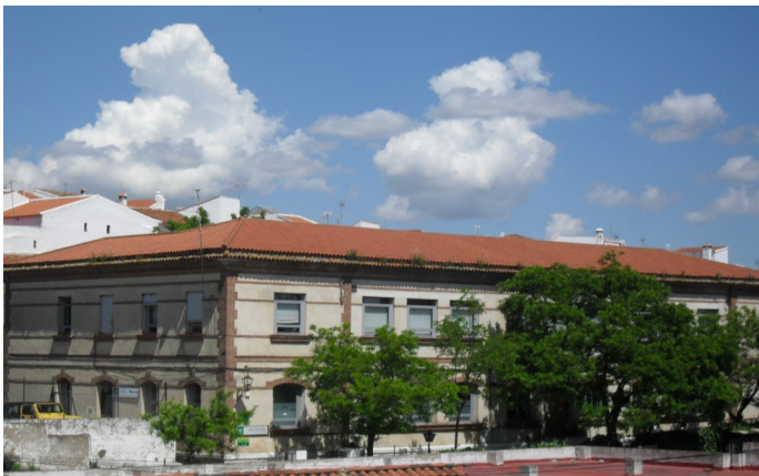
Edificio Sede de Mancomunidad de Municipios

En cuanto a Mancomunidad de Municipios, decir que en estos cuatro años sólo se ha celebrado un pleno extraordinario, con lo que queda patente que este organismo no está cumpliendo las funciones que tiene encomendadas, y parece que sólo sirve para gestionar la recogida de basura. Sus competencias no pueden quedar ahí. Hay que darle más vida a este organismo, aprovechar sus instrumentos materiales y medios personales, puesto que hay muchas cosas que hacer para mejorar nuestra comarca, y de forma colectiva siempre se hace más presión.